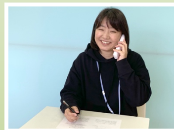
“電話”による支援の例 ～コミュニケーション支援&保護者相談～

電話は、手軽に活用できるツールです。[オンライン]に次いで、多くの方にご利用いただいています。お気軽にご利用ください。