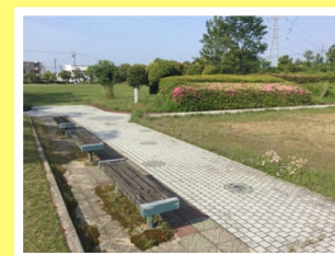
“訪問”による支援の例 ～散歩～

スタッフと会うことで、リフレッシュできたり、安心できたりするお子さんやご家族にご利用いただいています。