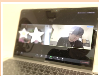
“ソーシャルスキル学習”の例 ～〇はどっち？～

使用するアプリは、Skype や Zoom などです。PC やタブレット、スマートフォンなどにご利用いただけます。設定の仕方についてもサポートさせていただきますので、安心してご利用ください。